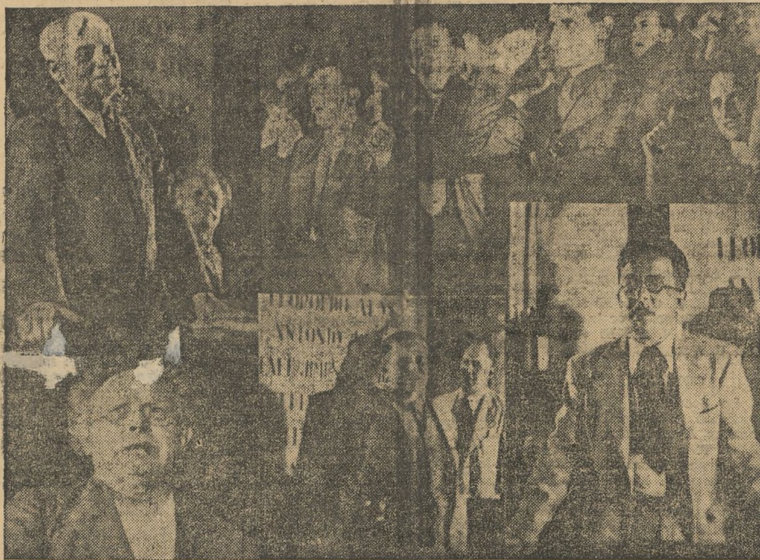
Varios aspectos de la Asamblea inaugural de las sesiones de Valencia (Información en quinta página)