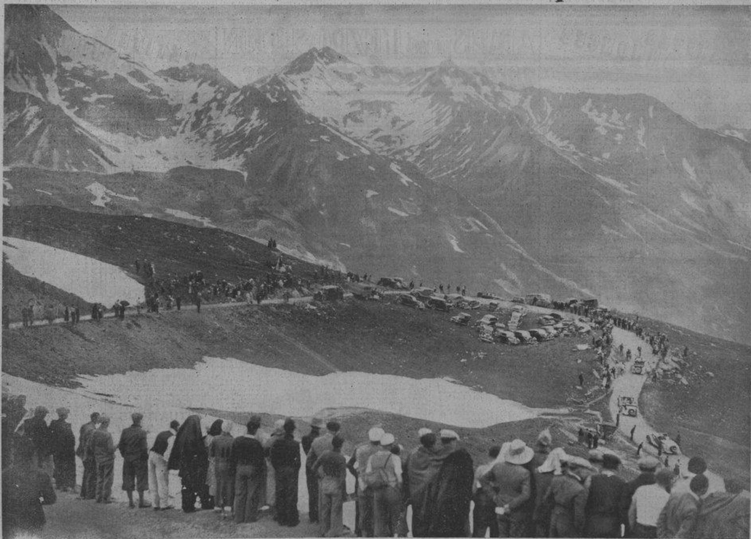
L'envolée victorieuse de l'Italien Bartali dans les lacets du Galibier géant