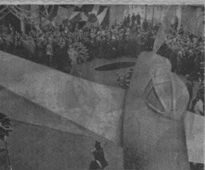
...a inauguré ce matin son pavillon à l'Exposition. Voici une vue de la cérémonie