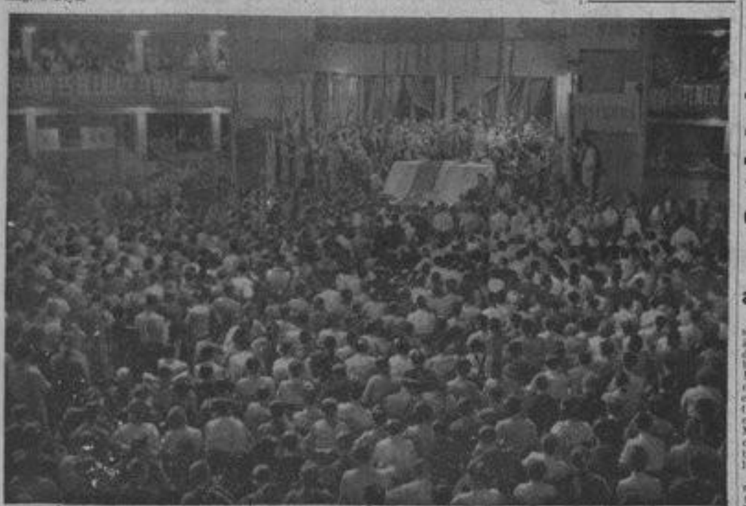
A Barcelone : le meeting d'accueil des écrivains. Au-dessus : l'ouverture du congrès à Valence par le président Negrin. (Premières photos parvenues en France.)

s'est réuni à Valence et Barcelone. Il siège à Madrid