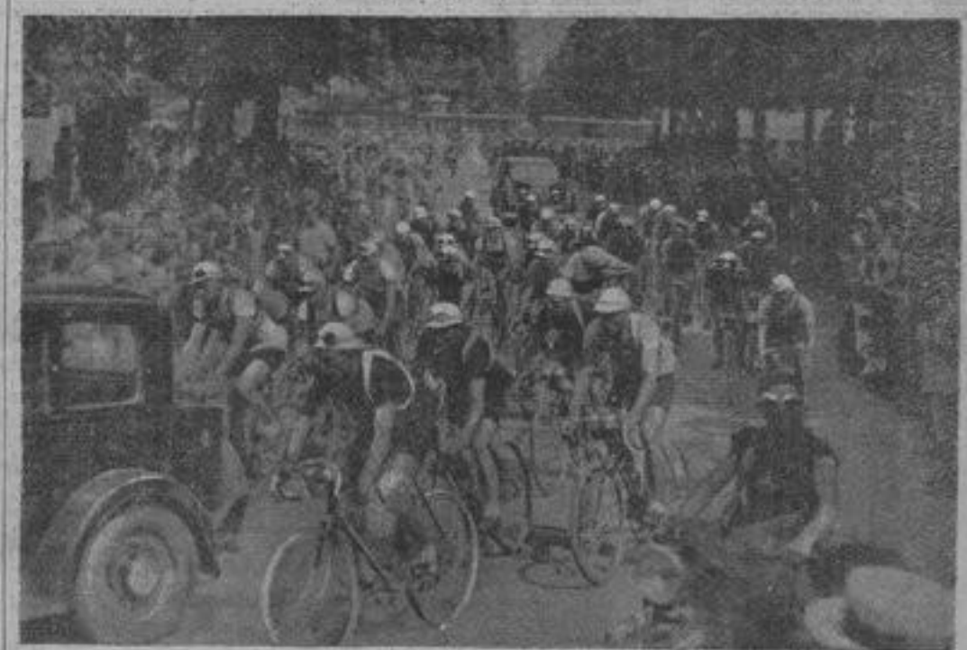
Le départ de Grenoble, ce matin, pour Briançon. (Document pris par un de nos envoyés spéciaux et transmis par notre poste télégraphique portatif.)