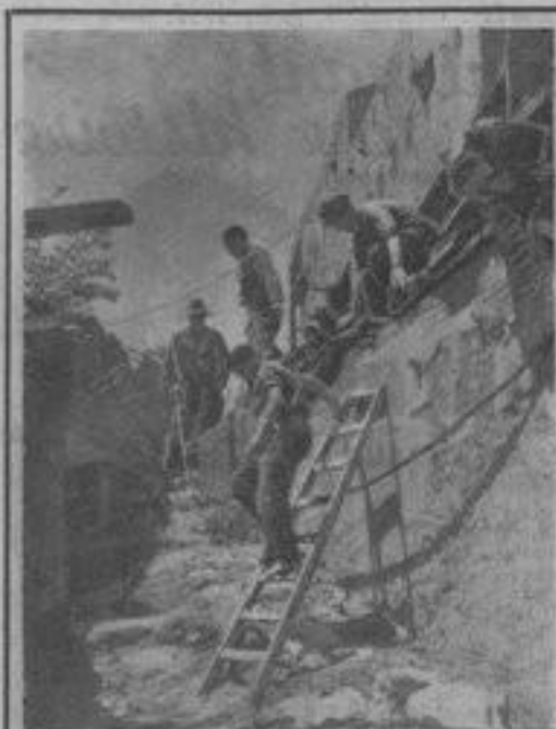
Sur le front d'Ussera... Près d'un pont coupé sur le Manzanares, un train blindé vient de prendre position pour bombarder les positions fascistes. Quelques servants, avides de plein air, quittent pour quelques instants le train et se dissimulent dans le remblai.