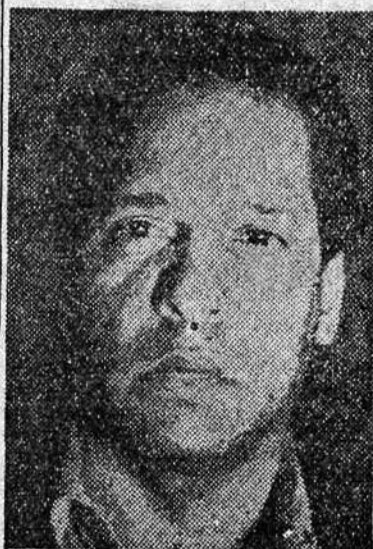
Nicolás Guillén, el magnífico poeta cubano, cantor de la raza negra, en un primer plano fotográfico

Ahora, Nicolás Guillén—una sonrisa blanca, de hombre sano, casi anunciadora de cualquier dentífrico, entre las sombras de la piel resuelta en escultura de nariz chata y cuello fuerte—está en España. Asiste, como delegado de Cuba, en nombre de los intelectuales antifascistas de su