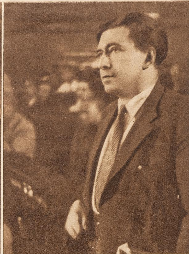
El escritor ruso Ilya Erenburg