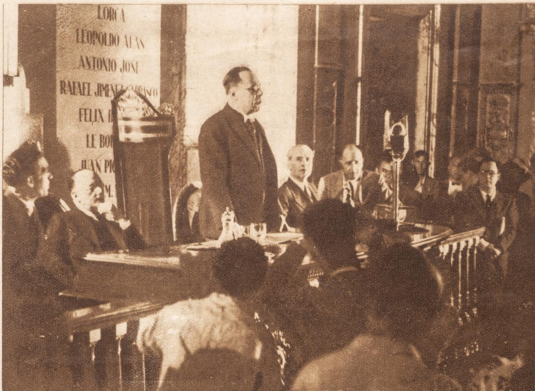
El jefe del Gobierno dirige unas palabras de salutación a los escritores antifascistas que se han reunido ahora en Valencia